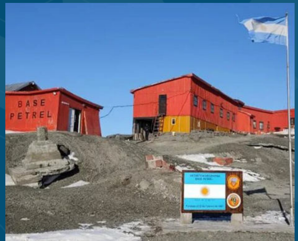
Base Petrel Programa Antártico Argentino Lat 63° 28' S - Long 56° 17' O

Originalmente se estableció en diciembre de 1952 como Refugio Petrel con una pequeña pista de aterrizaje. Durante el verano de 1966/67, se amplió la pista a 850 metros de largo por 40 metros de ancho y se instalaron balizas, junto con un gran hangar metálico como así otros edificios. El 22 de febrero de 1967 se inauguró como Estación Petrel. Durante el invierno de 1974, la estación tuvo que ser evacuado debido a un incendio, reanudando la operación durante los siguientes veranos. En febrero de 1978, se convirtió en una estación temporal de verano.